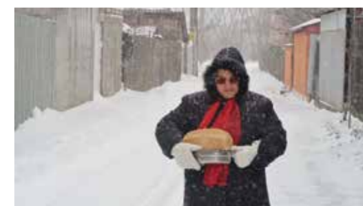
Tabel cu porțiile de mâncare și pâini distribuite - anul 2018

Săptămâna 1: 402 pâini și 363 porții Săptămâna 2: 722 pâini și 737 porții + 15 pâini București / Emanuel Săptămâna 3: 816 pâini și 747 porții + 7 pâini la bătrâna de la Filiași Săptămâna 4: 755 pâini și 771 porții Săptămâna 5: 773 pâini și 795 porții + 20 pâini înmormântare mama fr Titii + 3 pâini pt fata de la Gioroc Săptămâna 6: 775 pâini și 799 porții Săptămâna 7: 769 pâini și 769 porții Săptămâna 8: 769 pâini și 779 porții Săptămâna 9: 769 pâini și 779 porții Săptămâna 10: 769 pâini și 779 porții Săptămâna 11: 769 pâini și 779 porții